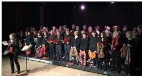
La chorale a interprété un répertoire de chants bulgares.

Ce dimanche 8 décembre, la Quinzaine Musicale proposait au Déclic deux concerts qui promettaient un vif succès. Et, comme annoncé, cela a été le cas.