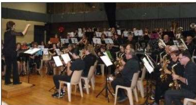
Samedi à la Source, l'harmonie de l'Insa (photo du haut) a été ovationnée. Dimanche, on pouvait applaudir l'harmonie de Claix, entre autres.

di, le public n'a pas ménagé ses applaudissements. Ce festival s'est achevé autour du pot de l'amitié et du gâteau d'anniversaire rappelant les 150 ans de l'harmonie dont les membres ont remercié l'ensemble des partenaires qui ont permis de réaliser ce projet ainsi que la