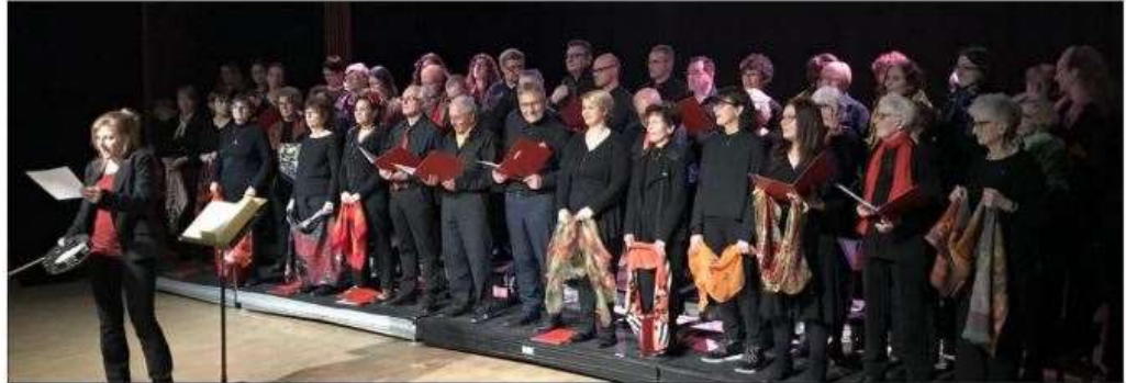
La chorale adulte a participé à cette Quinzaine Musicale, comme d'autres formations de l'école de musique clairoise.